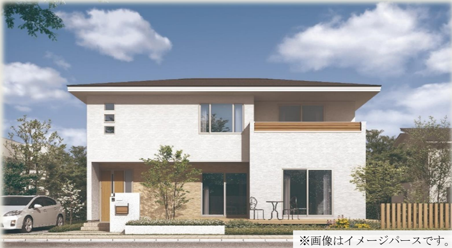
※画像はイメージパースです。