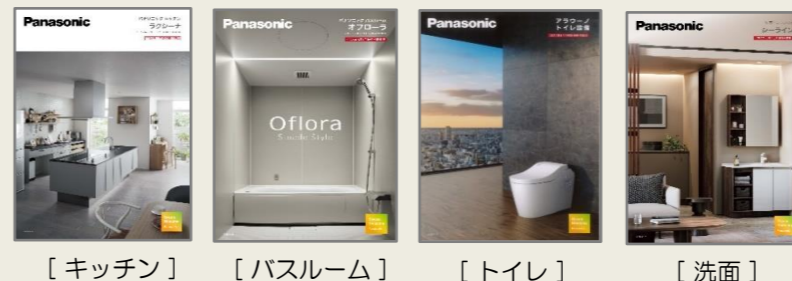
【キッチン】 【バスルーム】 【トイレ】 【洗面】