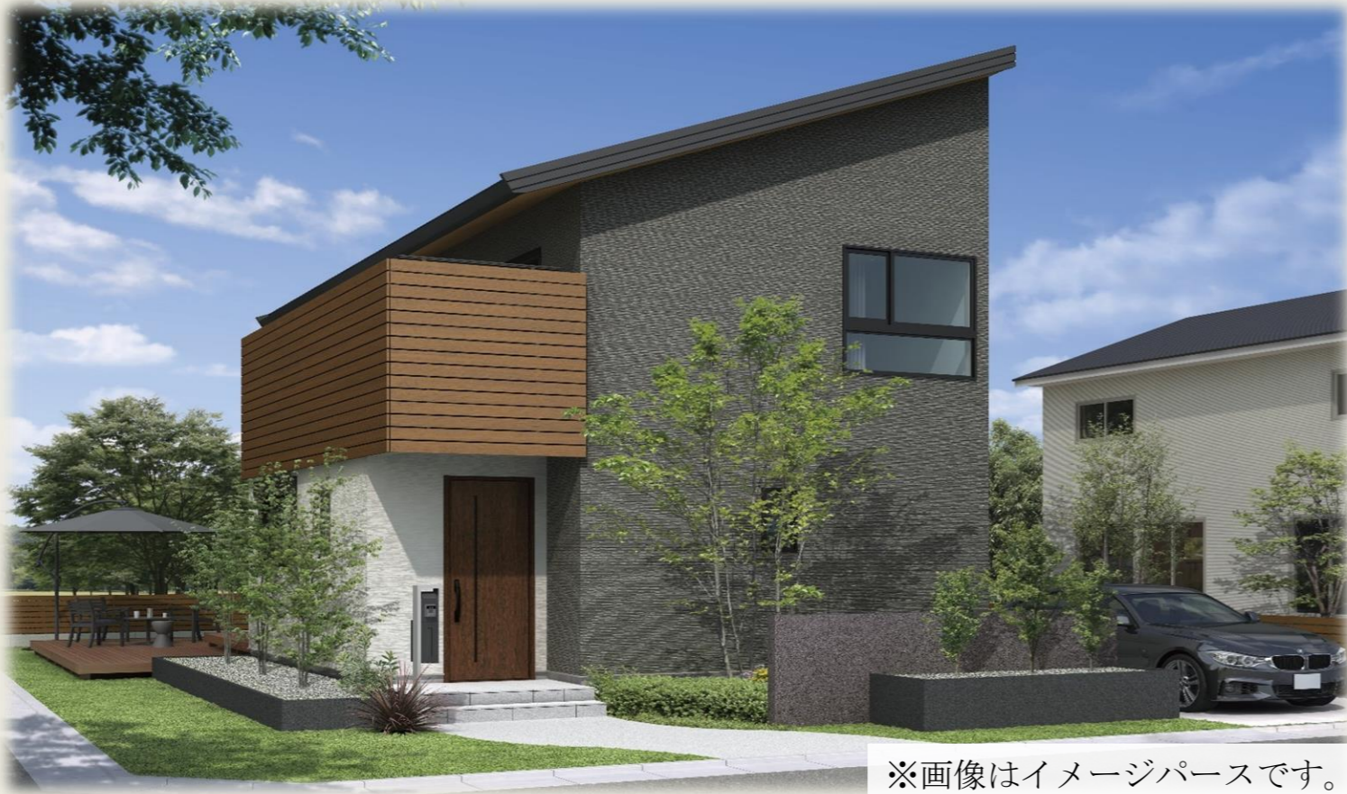
※画像はイメージパースです。